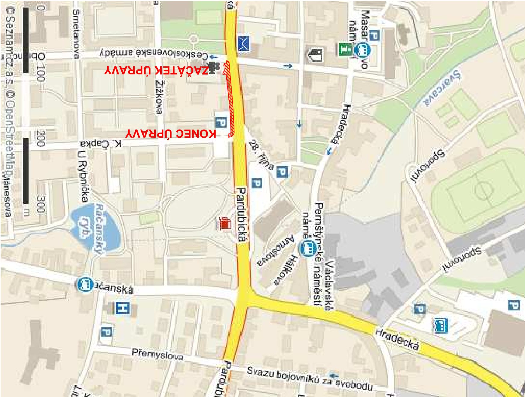
SO 101 CHODNÍKY